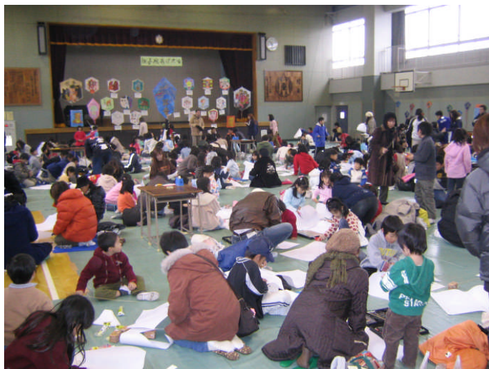
親子たこあげ大会