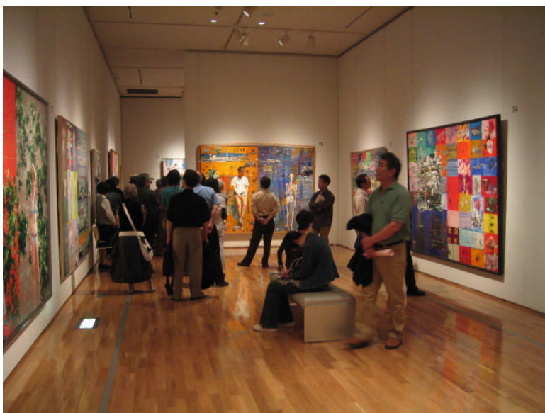
美術館での展示の様子