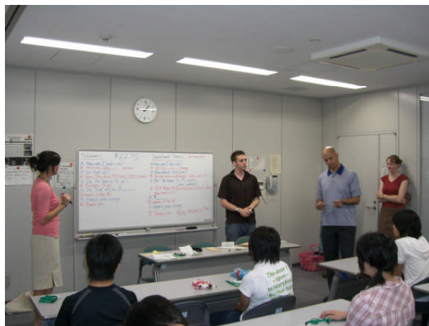
姉妹都市交流の事前研修会