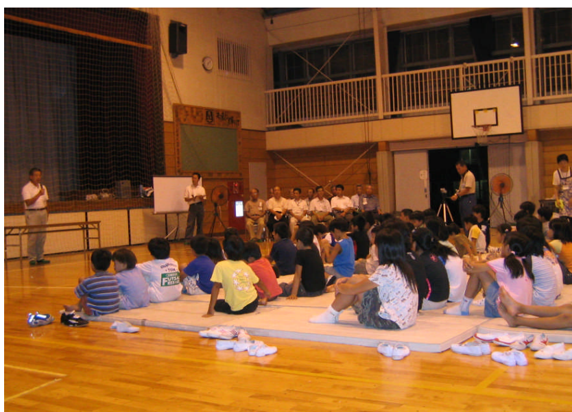
南古谷地区防災キャンプの様子

今後は、このような活動を通して、地域の教育力の向上のために、学校、家庭、社会教育施設、地域のさまざまな団体やボランティアが連携・協力を深めていくためのネットワークづくりを支援します。