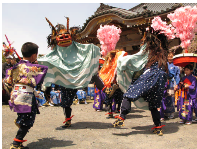
石原のささら獅子舞 (県指定無形民俗文化財)

観光の推進や地域コミュニティの強化などとも連動して、市民の理解と協力を得ながら、文化財の保存・活用と伝統的な文化の継承を図ります。