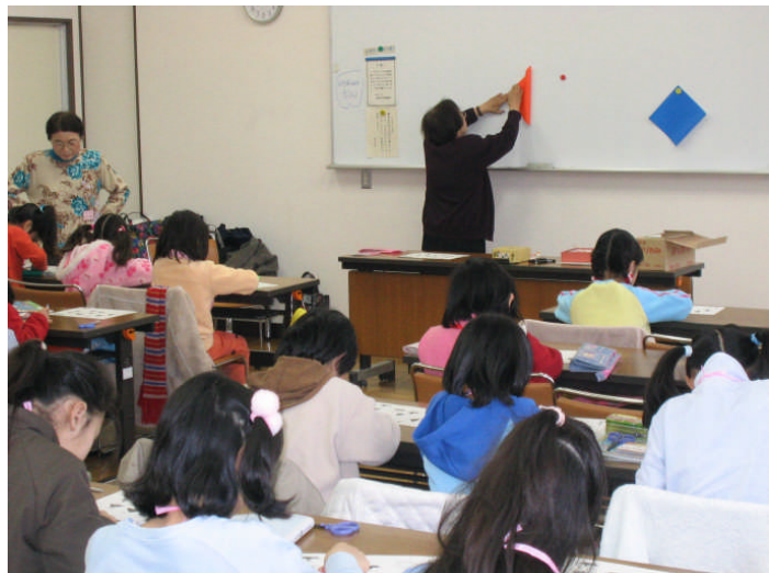
子ども折り紙教室