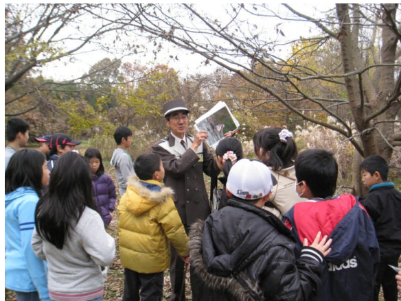
こどもエコクラブの活動