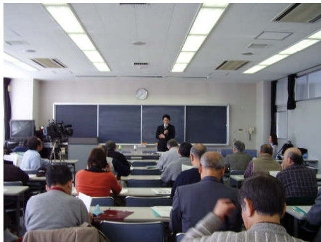
尚美学園大学のオープンカレッジ講座