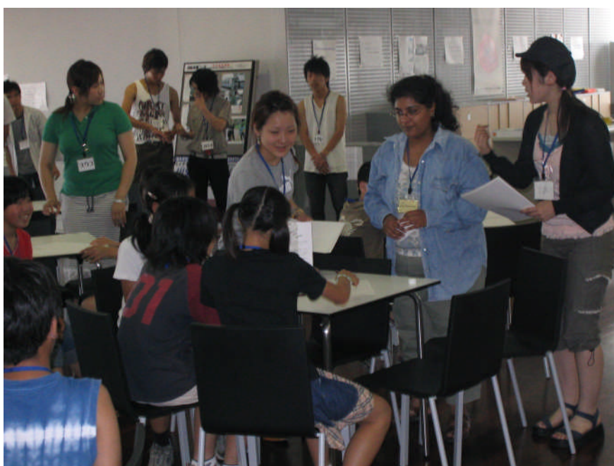
東京国際大学での英語体験講座

生涯学習への関心の高まりから、より高度で専門的な学習をしたいというニーズが増えています。こうした学習要求にこたえるため、市内にある複数の大学などの高等教育機関との連携を進めています。前期計画期間中には、市内4大学と市で包括協定を結びました。また、大学に協力を得て川越シティカレッジの充実にも努めてきました。今後も、生涯学習の推進について、専門的な立場から助言や援助をいただき、更に施策の充実に努めます。