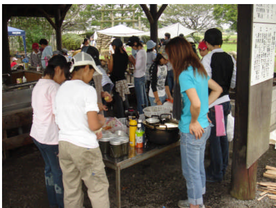
ジュニアリーダースクールの様子