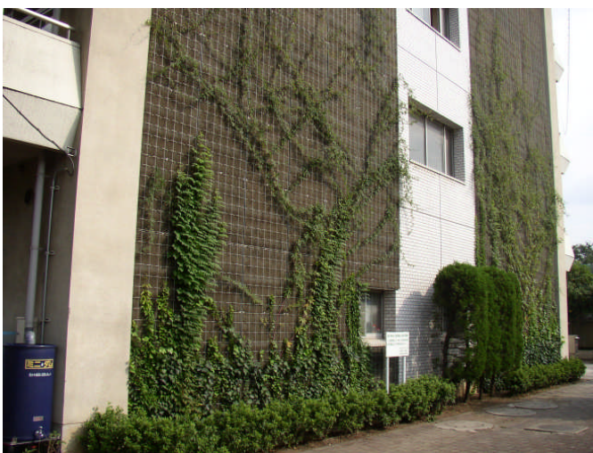
川越小学校の壁面緑化事業