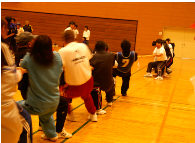
生涯スポーツフェスティバル