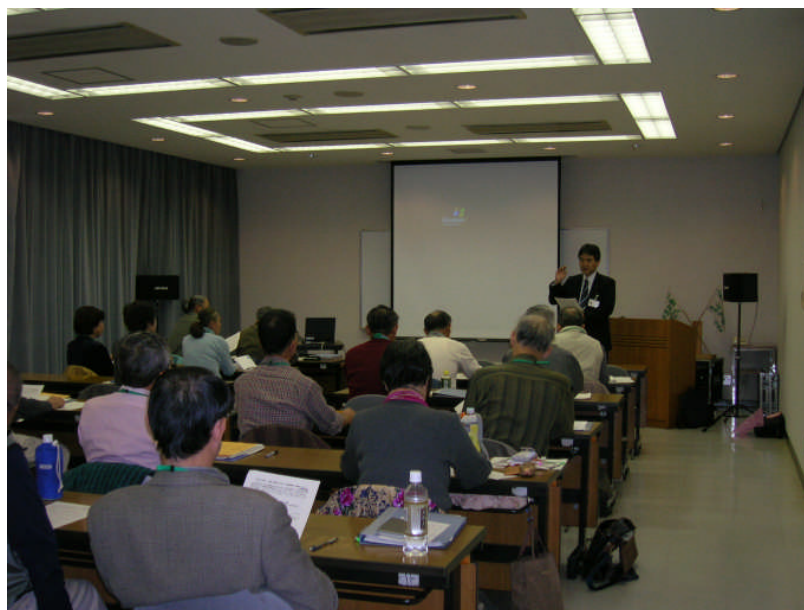
シニアカレッジ「ふるさと塾」

平均寿命が80歳を超える現在、市民一人ひとりの人生も多様化し、発達段階に応じた学習機会の充実とともに、いつでもどこでもだれでもが学べる環境づくりが求められています。行政による学習機会の提供に限りがある中で、市民との協働による学習機会の提供・充実に努めます。