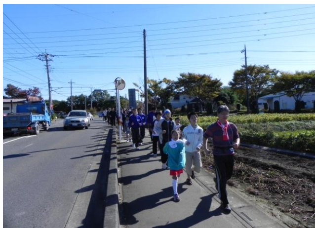
家族や仲間とともに、笑顔でウォーキング

そこで、市民（外国人を含む）の誰もが、いつでも、どこでもスポーツに親しみ、生涯にわたって心身ともに健康で、ゆとりと潤いのある豊かな生活を実現していくために、スポーツ環境を整え、市民一人ひとりが日常生活の中にスポーツを取り入れることのできる生涯スポーツ社会の実現に向けて、「第二次川越市生涯スポーツ振興計画」を策定します。