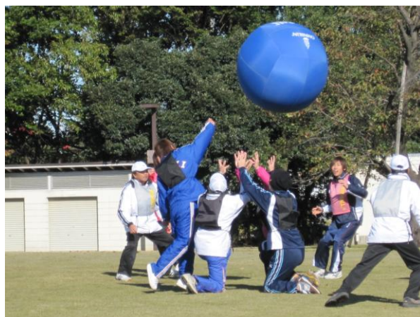
生涯スポーツフェスティバル