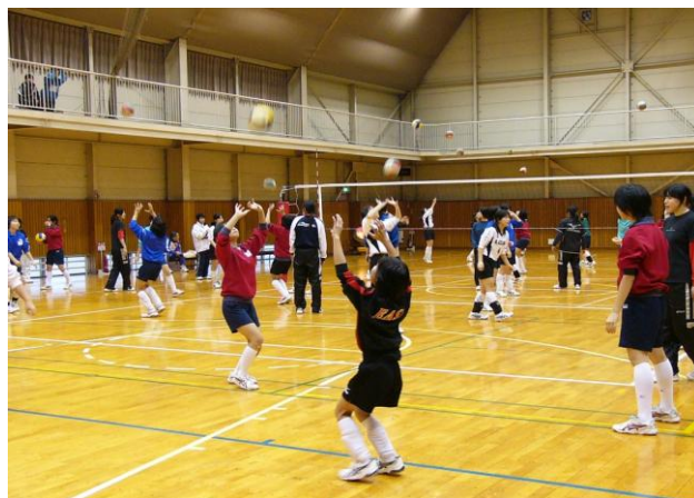
トップアスリートによる中学生バレーボール教室