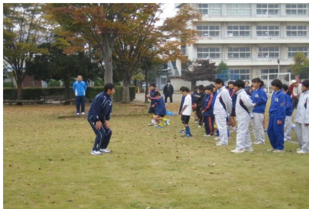
芳野スポーツクラブ 多くの小・中学生が参加したランニング教室