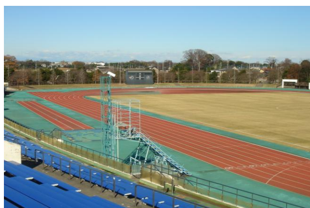
川越運動公園 陸上競技場