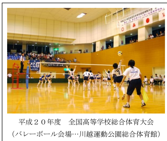
平成20年度 全国高等学校総合体育大会 (バレーボール会場…川越運動公園総合体育館)