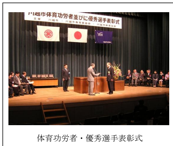
体育功労者・優秀選手表彰式