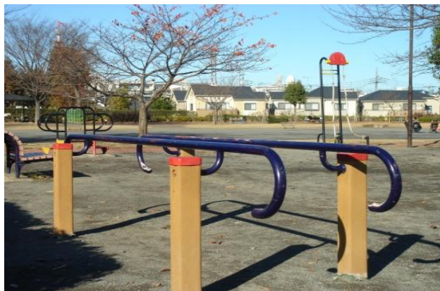
岸町健康ふれあい広場