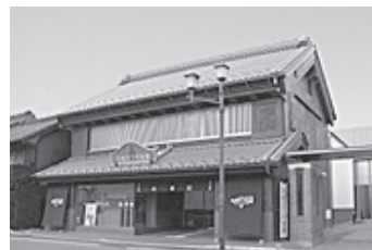
川越まつり会館の外観