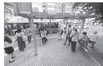
本川越駅5番バス乗り場