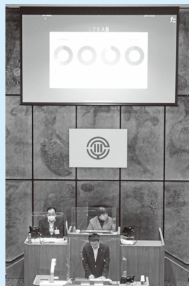
スクリーンを活用して一般質問を行う議員