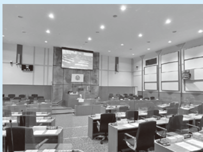
リニューアル後の議場