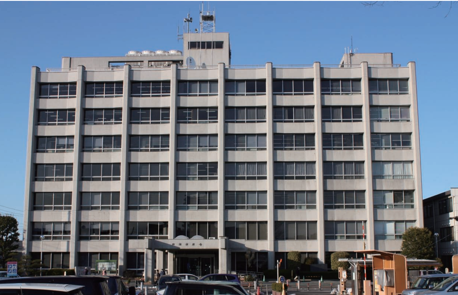
庁舎耐震工事が始まります