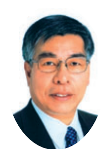
委員 本山 修一 日本共産党議員団