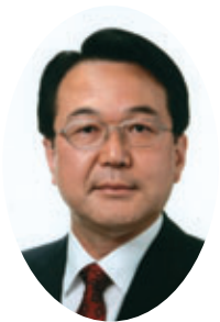
副委員長 大泉 一夫 公明党議員団