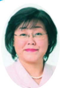
委員 若狭 みどり 公明党議員団