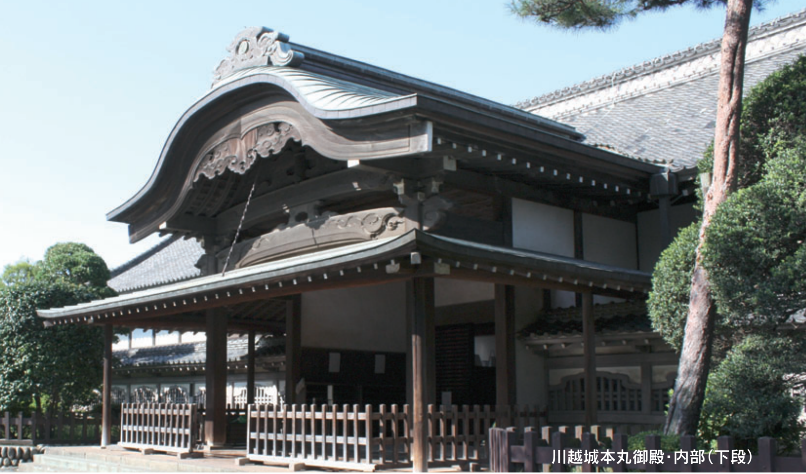
川越城本丸御殿・内部(下段)