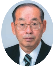
議長 大河内 銜