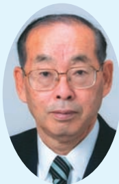
第39番 大河内 街 ③ 木野目1840番地 厚生常任委員会 啓政会