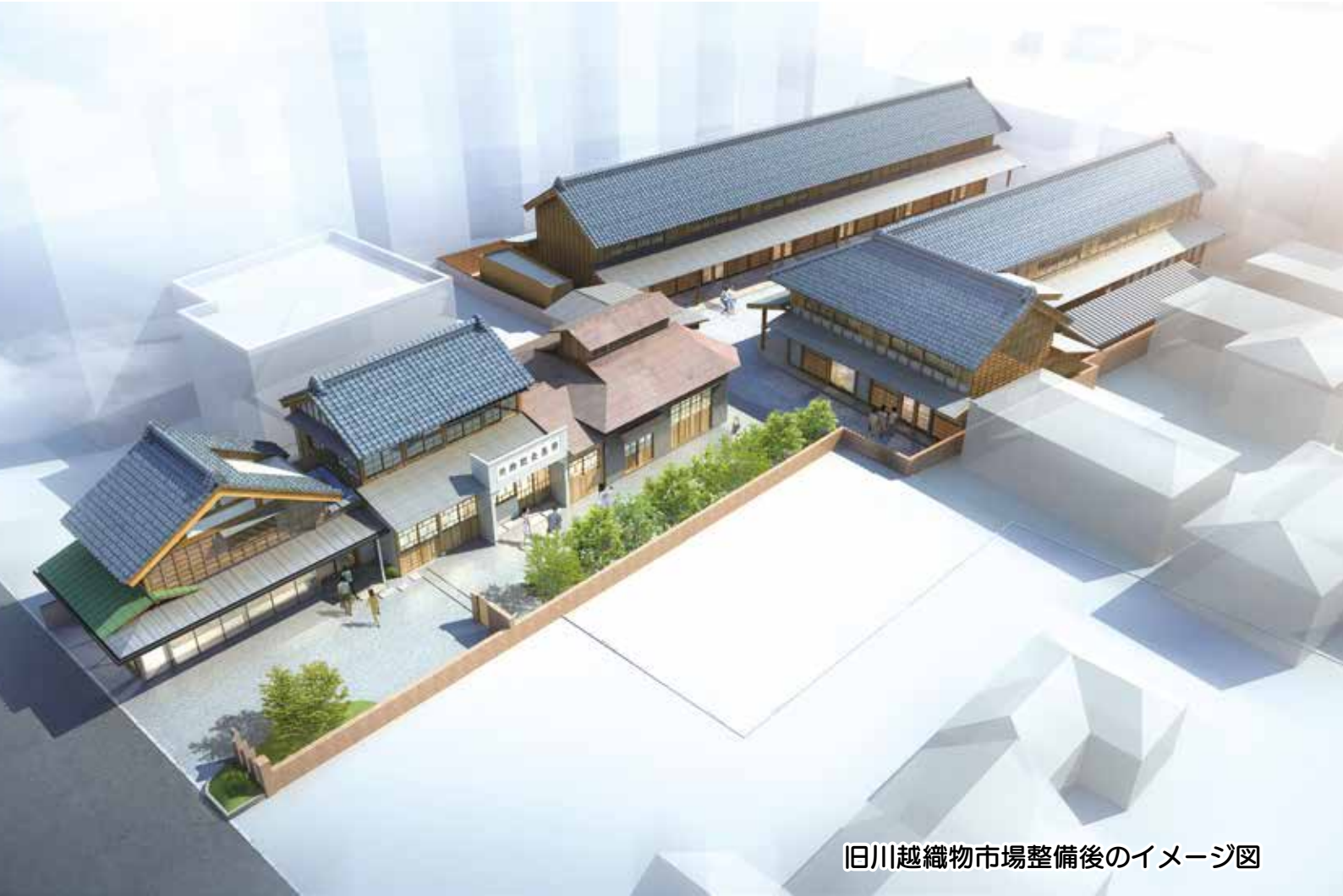
旧川越織物市場整備後のイメージ図