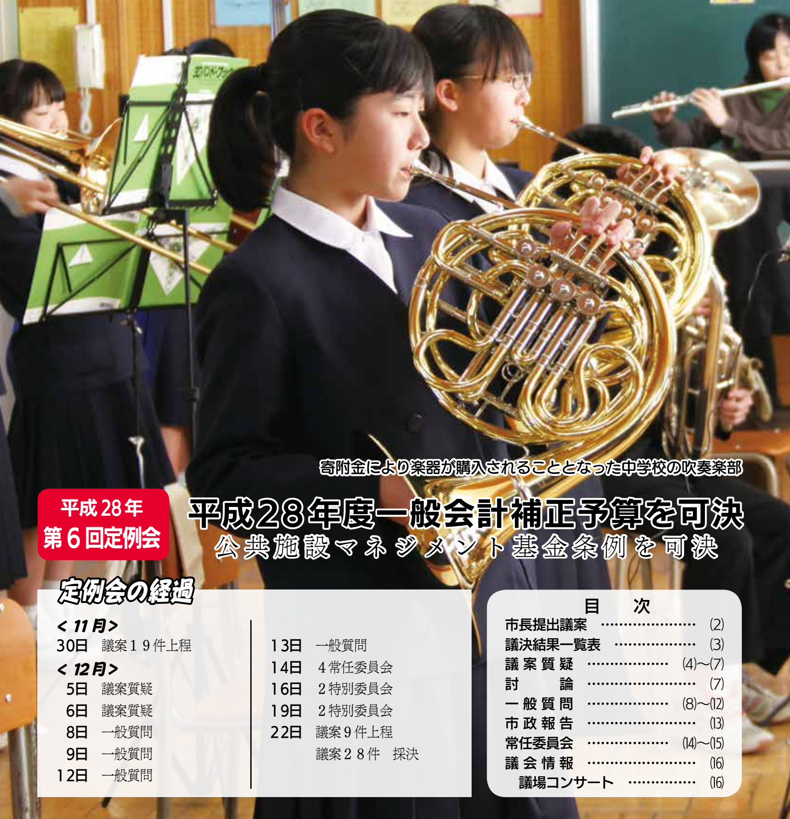
寄附金により楽器が購入されることとなった中学校の吹奏楽部