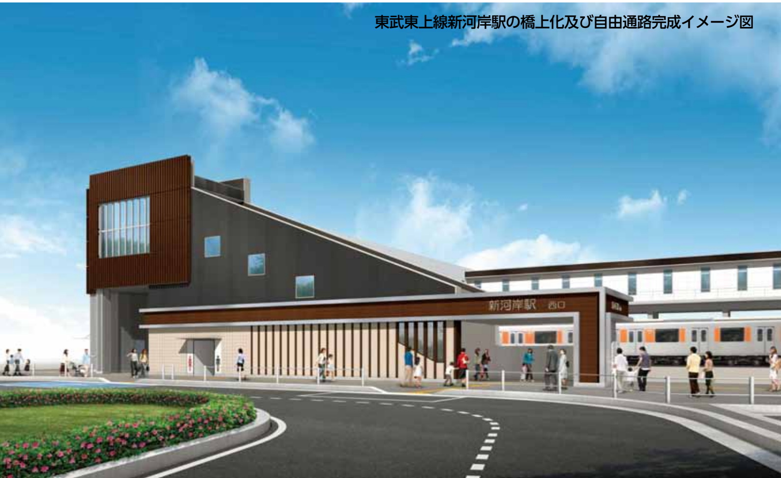
東武東上線新河岸駅の橋上化及び自由通路完成イメージ図