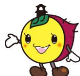
川越市マスコットキャラクター「ときも」