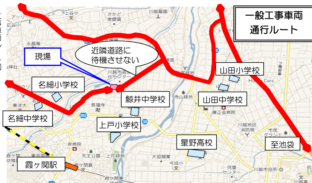
一般工事車両 通行ルート

※工事の概要や工事車両の通行ルートなどの詳しい情報につきましては、現場事務所にお問い合わせください。