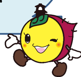
川越市マスコットキャラクター ときも