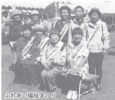
ふれあい福祉まつり