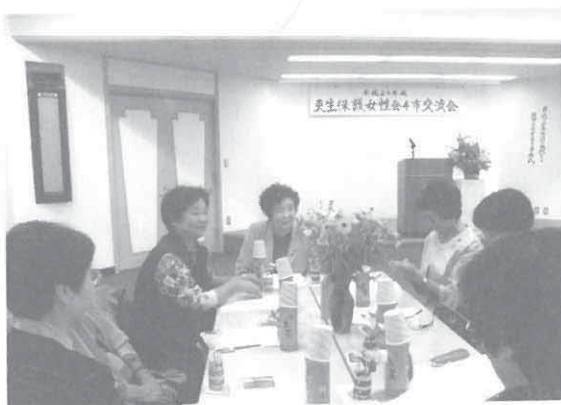
四地区交流会（富士見市にて）

十月九日、富士見市針ヶ谷コミュニティセンターに於いて、川越、坂戸、ふじみ野、富士見市より十名ずつ参加して四地区交流会が開催されました。午前には「最近の少年非行の現状について」東入間警察署草薙補導員による講演、少年犯罪の中で窃盗犯が60%と一番多いという話から始まり事例をいくつかあげた中で、埼玉県は、全国ワースト四位という残念な報告もありました。最後に「地域の子供は地域の目で」という言葉で締めくくられました。地域の大人達が、他人