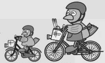
埼玉県マスコット「コバトン」

※道路交通法の改正により、全ての自転車利用者に対し、ヘルメット着用が努力義務化されました！