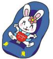
チャイルドシート着用推進シンボルマーク「カチャビヨン」