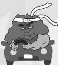
歩行者優先 イメージキャラクター 「さいたまお父さん」

※統一行動日とは、関係機関・関係団体が連携を図り、一斉に交通事故防止の啓発に努める日のことです。