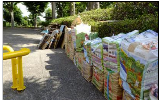
川鶴支部 吉田新町自治会 集団回収の様子

自治会や子供会など地域の組織や団体と協力しながら地域の実情にあった活動を行っています。