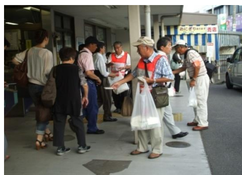
高階支部 駅前啓発の様子

自治会や子供会など地域の組織や団体と協力しながら地域の実情にあった活動を行っています。