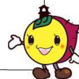
川越市マスコットキャラクター ときも