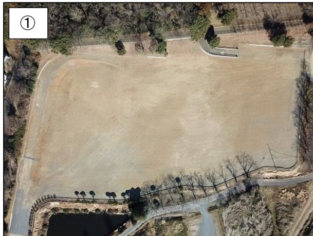
① 上空からの様子です。 （平成 31 年 1 月撮影）