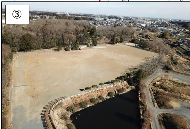
③ 南西側からの様子です。 （平成 31 年 1 月撮影）