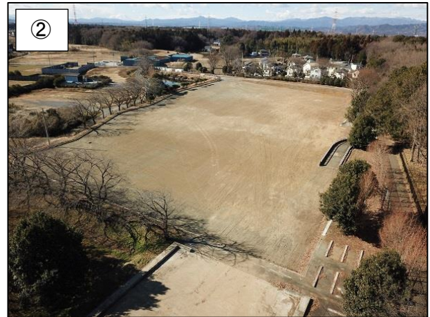
② 北東側からの様子です。 （平成 31 年 1 月撮影）