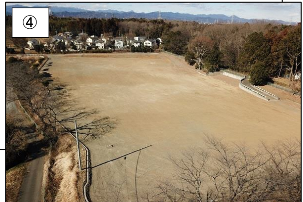
④ 南東側からの様子です。 （平成 31 年 1 月撮影）