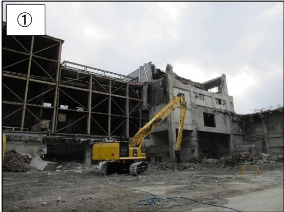
① 焼却施設(地上部分)の解体の様子です。

■ 焼却施設等の地上部解体が完了しました。(平成 29 年 9 月～11 月) 仮設テント内部で行っていた機器解体が完了し、仮設テントを解体しました。 また、焼却施設(地上部分)、煙突(外筒地上部分)の解体も完了しました。 ※ 図中の番号・矢印は、写真番号と撮影方向を示しています。