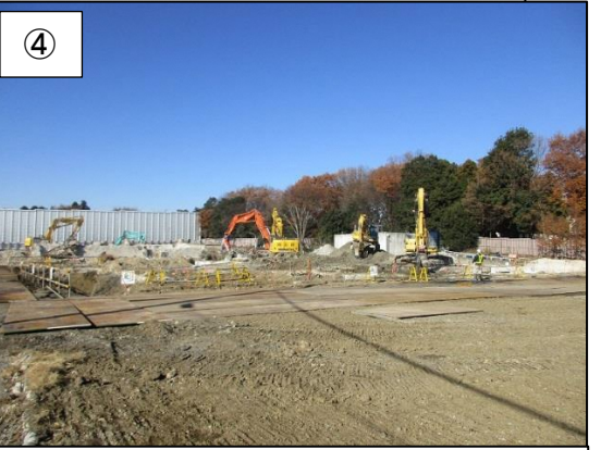
④ 焼却施設(地上部分)の解体が終わりました。