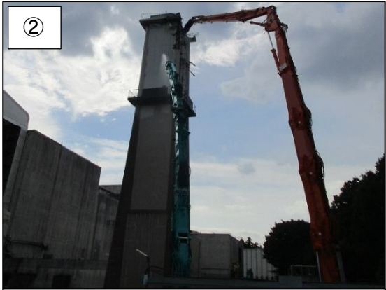
② 煙突(外筒地上部分)の解体の様子です。