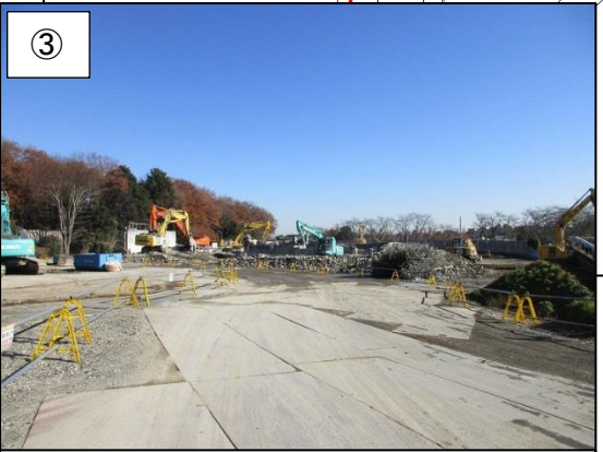
③ 焼却施設(地上部分)の解体が終わりました。