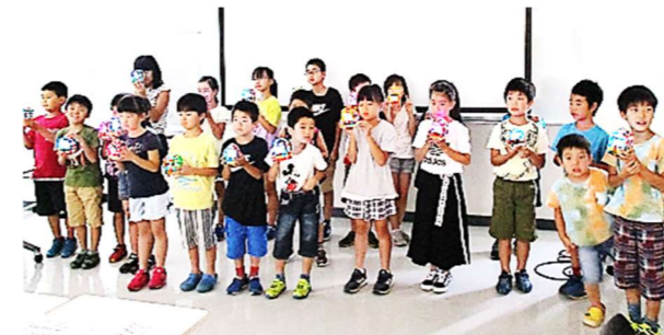
【夏休み工作教室 7/24実施】 親子でLEDランプをつくるとともに、エネルギーについて学びました。