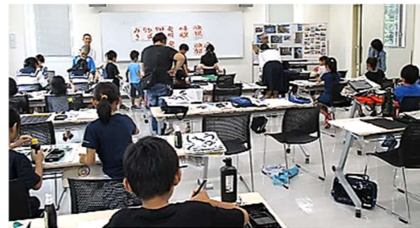
【ふれあい書道教室 7/22実施】 川越西高校の書道部のみなさんが、小学生に習字の指導をしてくれました。