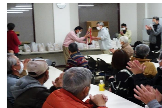
新狭山グランドボウル