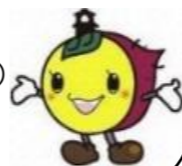
川越市マスコットキャラクターときも