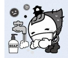
มาสดกดเมืองคะวะโกะเอะ โทะกิโมะ