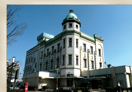
埼玉りそな銀行旧川越支店(旧八十五銀行本店本館)

店蔵は、明治26年(1893)に建てられたものである。昭和37年(1962)に通りに面する部分を改造し、蔵造りの外観は失われていたが、平成22年(2010)に復原修理を行い、建物本来の姿を取り戻した。現在は、建物を伝統的建造物に特定し、保存するとともに仲町観光案内所として活用している。蔵造り商家の名残が見られ、中庭は通り抜けができる。