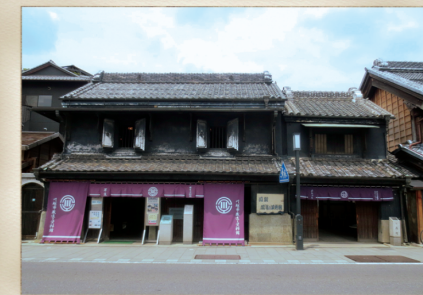
川越市蔵造り資料館(旧小山家住宅)