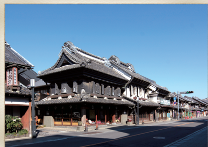
川越市川越伝統的建造物群保存地区