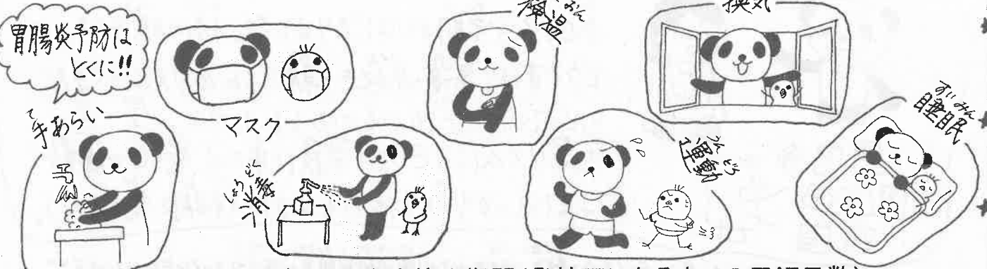
インフルエンザによる出席停止期間(登校可になるまでの最短日数)

寒い時期がまだまだ続くことを思うと、病気にならないか心配してしまいますね。しかし、予防方法は同じです。コロナ対策としてみなさんがいつも協力してくれていることが大切です。心配な症状がある時は、早めに病院でみてもらいましょう。インフルエンザは学校をお休みする期間が決まっています。下の表を参考にしてください。