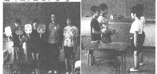
【1年生を迎える会の様子】

4月の始業式、入学式に始まり、1年生を迎える会や避難訓練、授業参観などの様々な行事が行われました。どの行事や活動にも一生懸命取り組む姿が見られています。その姿から、新しい学年での生活に期待や意欲が感じられます。少しずつ暑さの厳しい日も増えてきました。各ご家庭におかれましても引き続き、お子さんの体調管理や家庭学習の見守り、声掛け等ご支援、ご協力をお願いします。