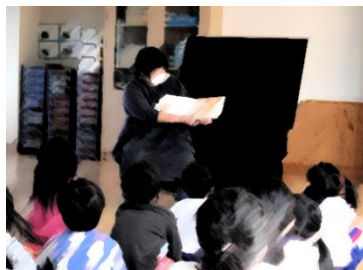
お話してくてくの皆様によるお話会