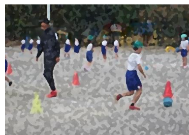
4年生 JFA キッズプログラム