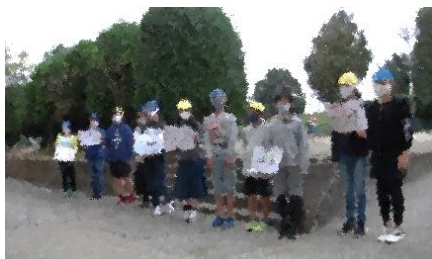
代表委員によるあいさつ運動

また、5年生の保護者の皆様には、安全なミシン学習にご協力をいただき、ありがとうございました。