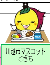
川越市マスコット ときも