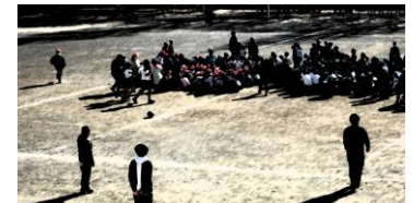
休み時間の避難訓練、 校庭にいた児童は中央に集まりました。

地震災害発生時の対応について、本市では在校中に震度5弱以上の地震が発生した場合、保護者様への引き渡しを行います。学校から連絡がなくてもお迎えをお願いします。以下についてご確認ください。