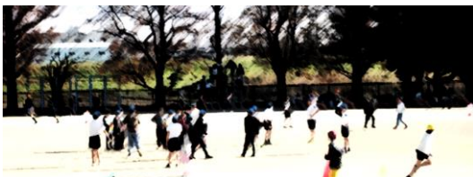
休み時間に広い校庭で元気に遊ぶ子供達、なわとび大会に向けた練習も始まっています。学校公開では、休み時間の様子もぜひご覧ください。

今年の干支は甲辰(きのえたつ)です。光に照らされ急速な成長と変化が起こる年であると言われる。6年生109名にとって、小学校生活は残り3ヶ月、卒業は大きな変化であり、成長の機会でもあります。ここで学ぶべきことを学び、新しい生活への準備を整えて、胸をはり、巣立ってほしいと願います。