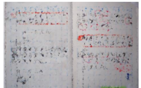
N1ノート賞後期のノート写真は校長室前に掲示しています。