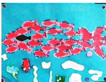
2年生各教室掲示 発表した音楽劇「スイミー」に合わせ、めあてを赤い魚に書きました