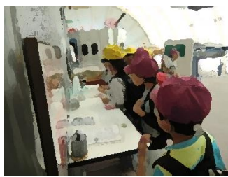
10/18 2年生 校外学習 航空記念公園