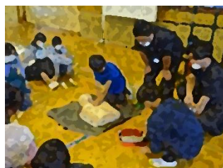
10/31 6年生 心肺蘇生法・AED出前授業