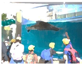
10/27 くすのき学級 校外学習 サンシャイン水族館