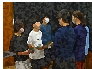
10/10 読書集会(図書委員会) お話会の皆様へ感謝の手紙を渡しました

本校では今年度「主体的に運動に取り組む 体育好きな児童の育成」を目指し、研究に取り組んでいます。 2学期は各学年等の研究授業を行っています。