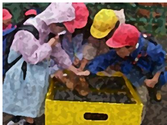
10/4 1年生 校外学習 こども動物自然公園