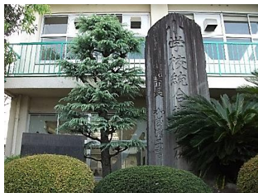
3校統合の記念碑(体育館前)

今年、本校は開校57年目を迎えました。昭和42年4月、名細南小学校(跡地は西文化会館)、名細北小学校(名細第2保育園)、下小坂分校(下小坂自治会館)の3校が統合されて開校された『開校30周年記念誌 小畔のあゆみ』にあります。現校舎建設の起工式は昭和42年7月28日、完成・移転完了は昭和44年3月17日とのこと。その間、統合前の校舎で授業が続けられていました。昭和43年10月23日に明治維新100周年祭を挙行し、この日を開校記念日としました。昭和50年には児童数1,687人、40学級の大規模校となり、昭和51年に上戸小学校が、昭和56年には広谷小学校が分離し、今に至っています。これまでに7,028人の卒業生を送り出しました。50周年には、マスコットキャラクターや「名細小かるた」等、今も愛され、大切にされているものがつくられました。