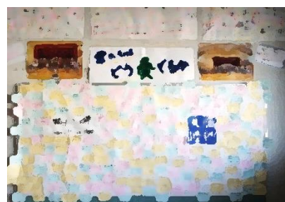
5年生学年掲示板 一人一人の思いや学級での話合いの内容が日々更新されていました