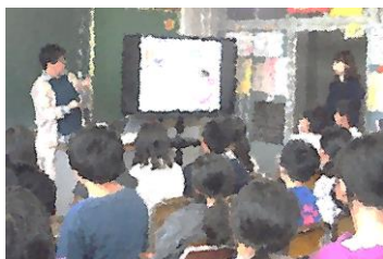
10/5 4年生 手話体験講座