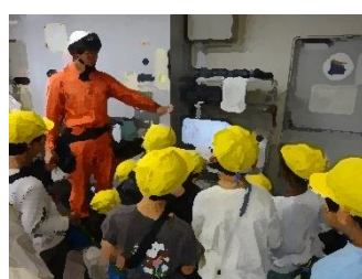
10/30 3年生 校外学習 消防署見学