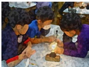
10/31 5年生 小・中・大学連携理科ふれあい事業