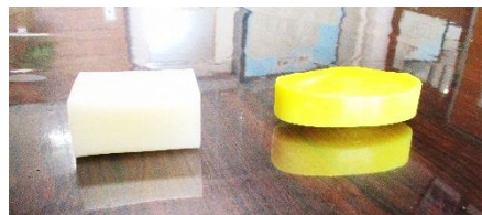
無添加せっけん レモンせっけん