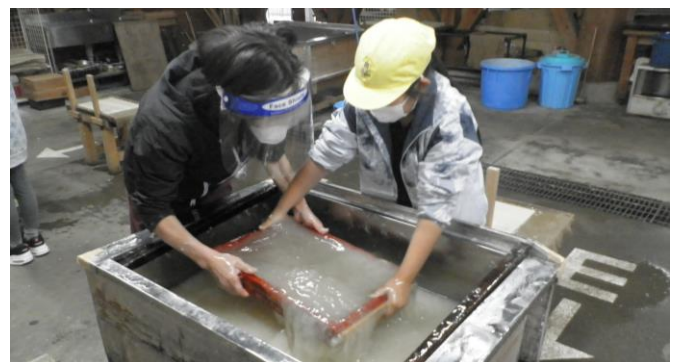
〈4年生 社会科見学〉きれいな和紙ができますように