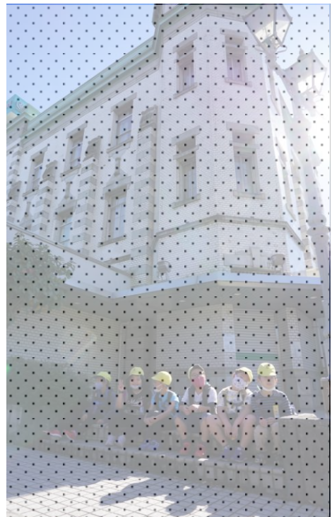
くすのき 校外学習 川越にはおもしろい建物がいっぱいあるよ