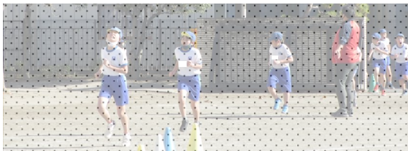
〈5年生 持久走記録会〉No Pain, No Gain. 最後まで走りきるぞ