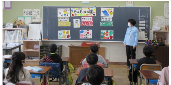
〈2年生 食に関する指導〉よし、野菜も食べるぞ！！