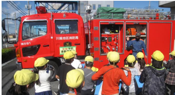
〈3年生 消防署見学〉まちを守ってくれてありがとう