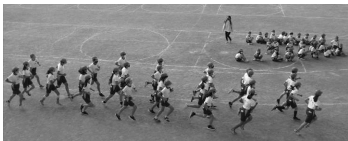
※初めて朝マラソンに参加する1年生は、高学年の走る姿を見てびっくり!!

コロナ禍において、子どもたちの運動時間や運動経験は少なからず減少しているものと思われます。今月26日まで行う「走ろう月間」の取り組みと合わせて、日常的な運動習慣を取り戻す機会になるよう働きかけていきます。