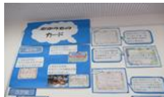
たからものカード

南小には、礼を尽くす日があります。30日はあったか言葉の日になっています。今週、代表委員会からの提案で、「あったか言葉大作戦」をすることになりました。これは、あったか言葉を掛け合うことで、温かい人間関係をつかっていくことをねらいとしています。取組として、あったか言葉についてカードに書いたり紹介したりします。また、「ありがとうの数」という詩の暗唱に挑戦します。この詩は、6年生の計画委員の児童が見つけたものです。ご家庭でも是非、この詩を聞いていただきたいと思ひます。そして、「ありがとう」の言葉やあったか言葉が広まっていくことを期待しています。