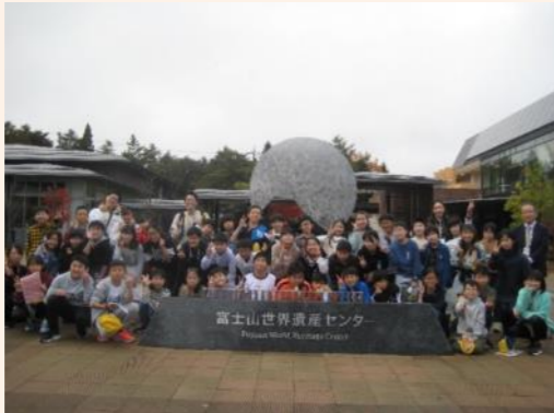
11/9 5年林間学校 富士山世界遺産センター