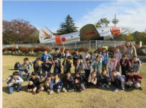
11/19 2年 航空記念公園