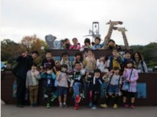
11/2 1年 子ども動物自然公園