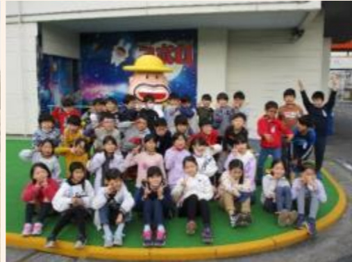
11/18 3年 明治なるほどファクトリー