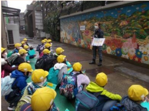
12/17 4年 三富今昔村