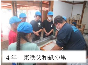
4年 東秩父和紙の里