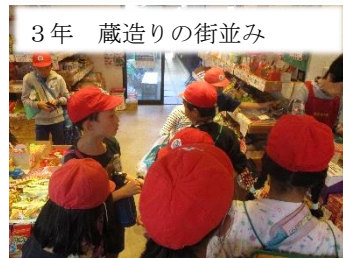
3年 蔵造りの街並み