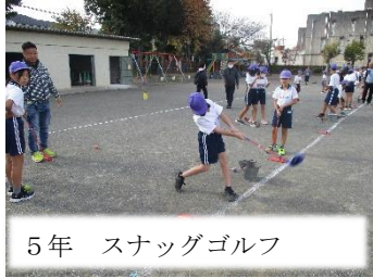
5年 スナッグゴルフ