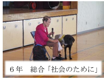
6年 総合「社会のために」