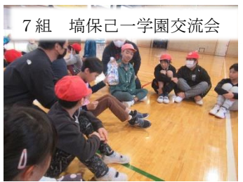
7組 塙保己一学園交流会