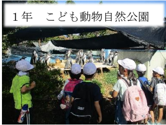
1年 こども動物自然公園