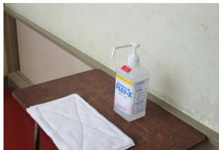
教室には、消毒液が用意されています。

自宅で検温をしなかった児童・健康観察記録用紙を持ってこなかった児童は保健室で検温します。非接触型の体温計です。