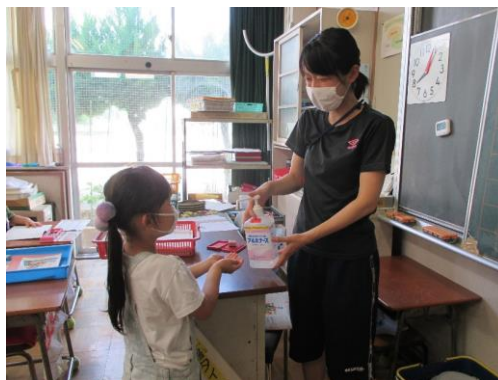
教室でも、手指の消毒を行います。