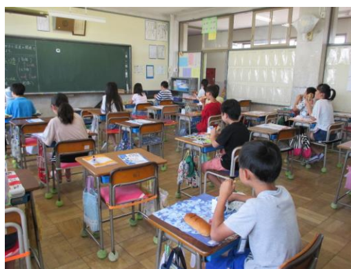
児童と児童の間も十分に感覚をとって並びます。