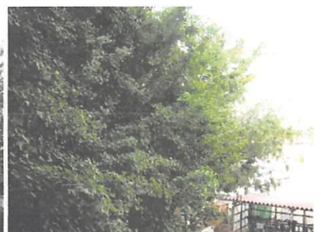
八重桜の葉、銀杏の葉もどんどん大きくなっています。