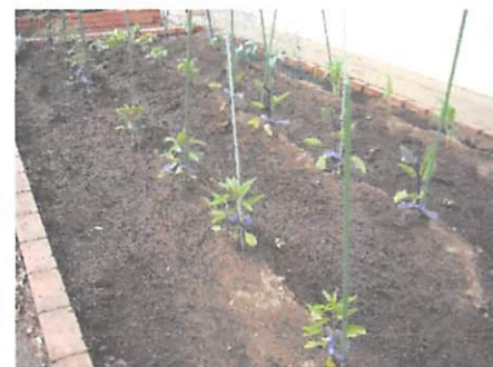
2年生の野菜もすくすく育っています。