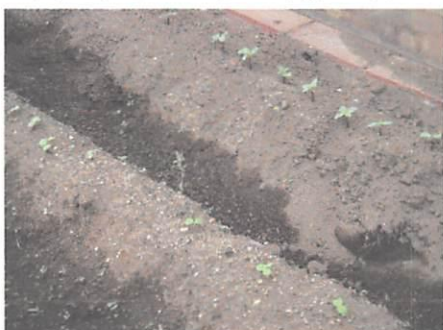
1年生の花壇は芽が出てきました。