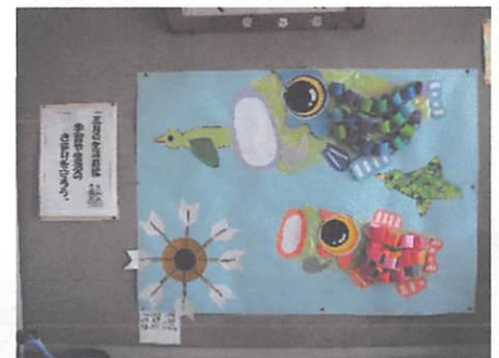
職員玄関の掲示は、5月です。