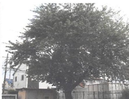
門のところの桜の木の葉も青々としてきました。