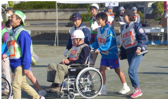
車いすの避難者の避難を手助けしました。

日頃から、自分の命を守ることはもとより、地域社会のためにできることを考え行動する中学生であってほしいと考えます。地域社会において、「助けられる存在」から「助ける存在」になることを期待しています。