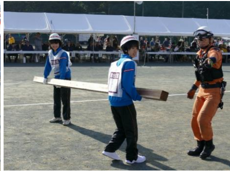
救出活動でかげきの撤去を手伝いました。