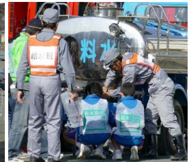
給水車の水を避難所へ輸送しました。