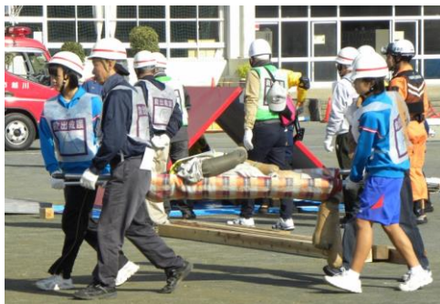
救出者を救護所へ搬送しました。