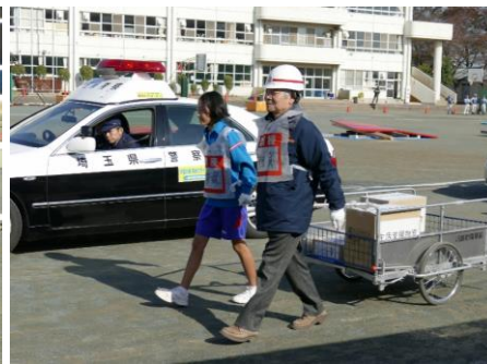
支援物資を避難所へ輸送しました。