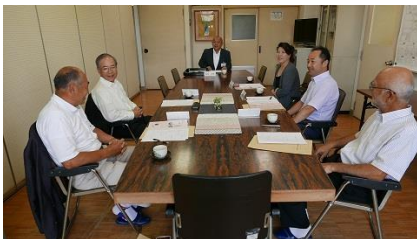
協議の様子（小会議室）