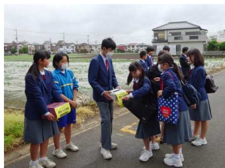
〈H28. 5. 23 付埼玉新聞に生徒会が実施した募金活動の様子が紹介されました〉

▼川越市立高階西中学校(川越市砂新田) 2万9070円 同校生徒会は「復興に向けて自分たちのできることはないか」と考え、5月10、11日に募金活動を行った。登校時に校門であいさつ運動を兼ねて募金を呼び掛け、生徒や職員が協力した。写真。