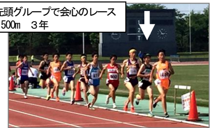
終始先頭グループで会心のレース 男子1500m 3年