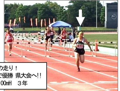
圧巻の走り！ 大差で優勝 県大会へ！！ 女子100mH 3年

※以上の結果、1年1500m 男子二名、 1500m 3年男子、100mH 3年女子 の四名が 6/9・10に熊谷スポーツ文化公園陸上競技場で行われる通信陸上競技大会県大会に出場します。