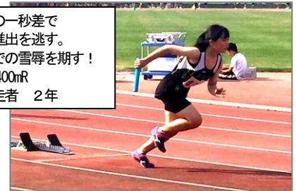
千分の一秒差で 決勝進出を逃す。 学総での雪辱を期す！ 女子400mR 第一走者 2年