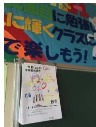
学級カレンダー （3年生教室） 卒業までのカウントダウンで所属感を高めます。