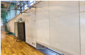
体育館 内壁（一部） 傷みの激しい部分から張り替えを行いました。