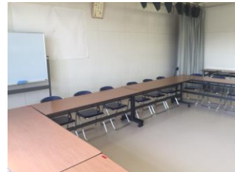
スタジオ フロアマット PTA 理事会をはじめ各種会議等で使用する部屋の床を張り替えました。