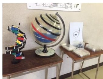
関心・意欲を高める教具 （理科室前の廊下） 見て、触れて、確かめて…。 好奇心は学ぶ意欲を引き出します。