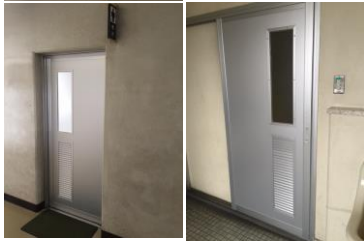
トイレ ドア（一部） 老朽化から開閉にかなりの力を要していたドアを取り替えました。