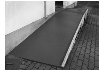
外トイレ 身障者用スロープ 老朽化していたスロープのマットを張り替えました。