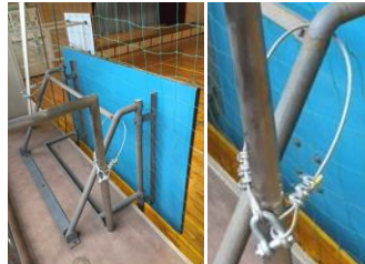
体育館 設備耐震補強 バスケットゴールや照明等に落下防止器具を取り付けました。