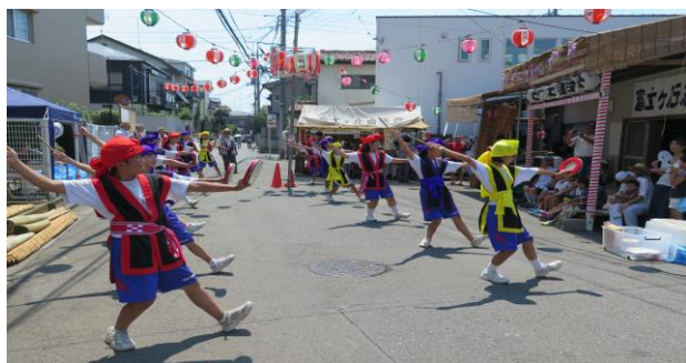
H27/7/26 富士ヶ丘納涼祭でのエイサー演舞

など、地域の様々な催事等に参加させていただきました。各会場での演舞は好評を博しました。