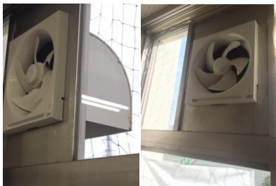
理科室 換気扇（複数） 故障していた換気扇を新しいものに取り替えました。

本校では、日常点検はもとより毎月一回「安全点検週間」を設定し、教職員による施設・設備の点検を行っています。例えば、普通教室については、「カーテン、暗幕の破損はないか。」「蛍光管がきちんと取り付けられているか。」「机・イスの損傷はないか。」など16項目からなるチェックシートに基づいて、原則として各清掃指導場所を教職員が点検しています。