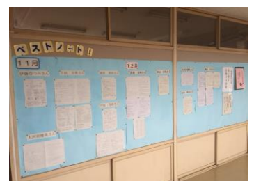
バストノートの掲示コーナー （1年生廊下） 他の人の優れた実践を見ることで学ぶ意欲が一層高まります。