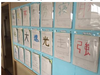
生徒一人一人の掲示コーナー （1年生教室） 自分を表現できる掲示物は自己有用感をはぐくみます。

本校では、教室や廊下の掲示物や展示物を充実させ、生徒の自己有用感をはぐくんだり学級への所属感を高めたりする環境づくりを推進しています。また、生徒の学ぶ意欲を引き出すための工夫にも取り組んでいます。