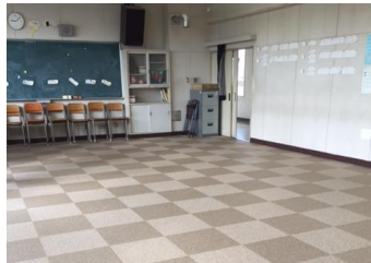
視聴覚室 カーペット 学年集会や吹奏楽部の練習等で使用する部屋の床を張り替えました。