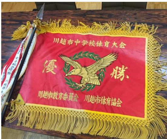
↑ 栄誉を讃える「川越市女子総合優勝旗」

9月に行われた川越市新人体育大会において、女子バレーボール部優勝、女子バスケットボール部準優勝をはじめとする活躍が「女子総合優勝」という栄誉に輝きました。