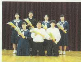
旧本部役員の皆さん

また、新生徒会本部役員の皆さん、全校生徒240名の代表として、鯨井中学校の顔として、これからの1年間、本部役員同士で仲良く協力し合って、鯨井中学校(全生徒)のために取り組んでいってください。