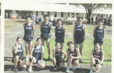
大会終了後の記念撮影