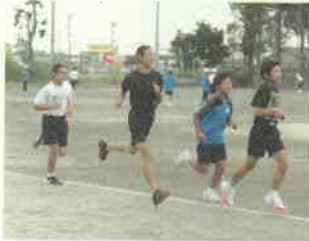
大会に向けての練習のようす

1, 2年生の皆さんは、これからの1年間自分の体を鍛えて、来年度のこの大会にぜひ参加してみてください。よろしくをお願いします。