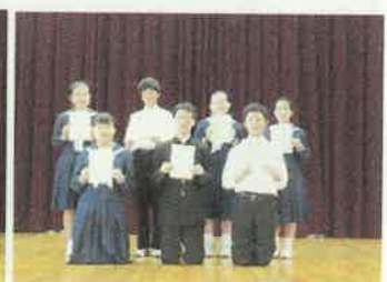
新本部役員の皆さん