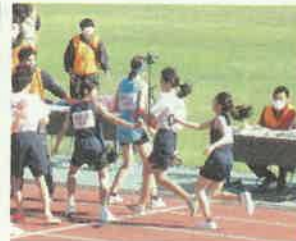
女子のレースのようす