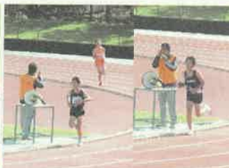
男子のレースのようす