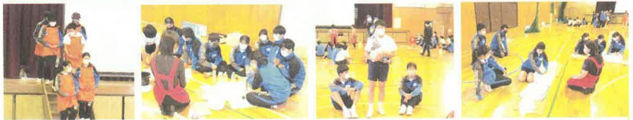
妊婦体験 ほ乳びんミルクづくり体験 赤ちゃん人形だっこ体験 赤ちゃん人形沐浴体験

10月20日(水)に3年生を対象として、生命の誕生を通しての命や家族の大切さなどについて学びました。新型コロナウイルス予防のため本当の赤ちゃんは来られませんが、人形等を使っての4つの体験をしました。今日の授業を通して、今後も命や家族を大切にしたい生き方に結びつけていってください。