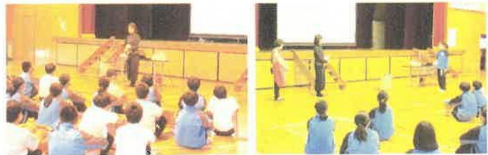
誕生学の講義 講師の先生へのお礼の言葉

11月10日(水)より全校三者面談が始まります。ご多用とは存じますが、ご協力をお願いいたします。また、川越市は、11月から12月までがいじめ対応強化期間になっておりますので、お子さんにつきまして不安や心配な事などがありましたら、この機会を利用してお気軽にご相談ください。