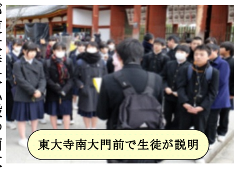
東大寺南大門前で生徒が説明

2年生が2学期の半ばから力を合わせて着々と準備を進めてきた修学旅行が2月14日から2泊3日の日程でありました。事前の健康管理が万全でインフルエンザ等の疾病で欠席する生徒もなく、参加予定の生徒は、全員参加できました。東京駅までの東上線、山手線内では通勤客の迷惑にならないことなく、静かに落ち着いて乗車していても感心しました。◆1日目の奈良公園ではバスガイドさんから離れて、学習班の生徒