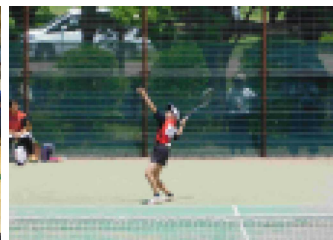
【女子ソフトテニス】