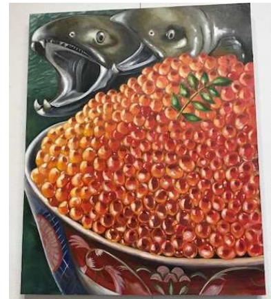
【入賞したSさんの作品】