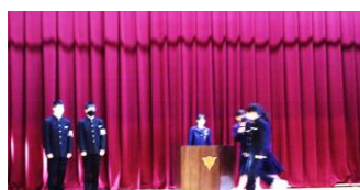
生徒朝会(あいさつについて)