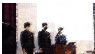
始業式 生徒代表の言葉

○新型コロナウイルス感染症への対応について(再掲) これまでと同様に、お子さんまたは同居のご家族に風邪症状があるときは学校へ連絡の上、登校させないでください。感染予防のための出席停止となります。また、万が一、本人及び同居のご家族の方が罹患、または濃厚接触者、PCR検査等の対象となった場合は保健所の指導に従っていただくとともに学校へも連絡をお願いします。休日・夜間の場合は川越市代表電話(224-8811)に連絡をお願いします。保護者の皆さまも健康に留意し、感染予防に努めていただきますようお願いいたします。