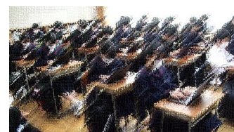
GIGAタイム(タイピング)